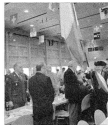
Einzug der Kantonal-Schützenfahne.